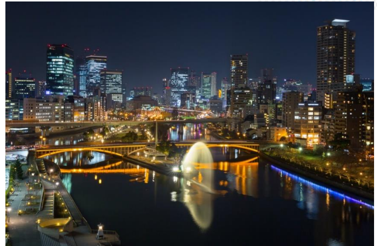
大阪府立中之島図書館