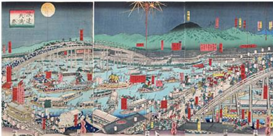
浪速天満祭（貞秀画、1859年）